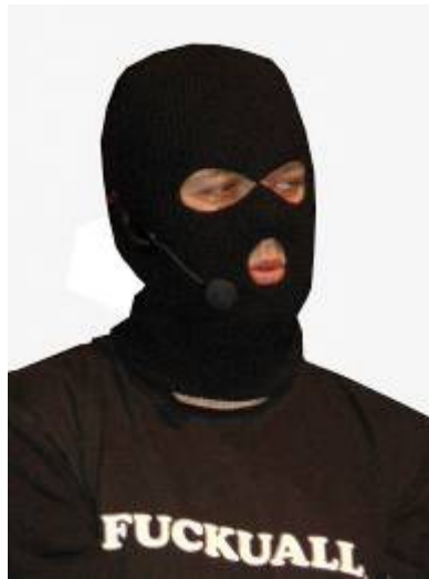
Gast aus dem Knast